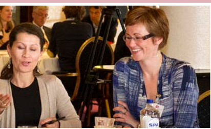
Regiobijeenkomst Haarlem 24 april